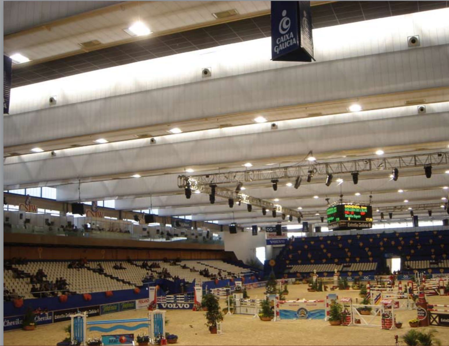
PROYECTO_ IFEVI (Instituto Ferial de Vigo). 10.000 m 2 de panel sandwich de cubierta, 5.000 m 2 de policarbonato translúcido en cubierta, 2.500 m 2 de panel arquitectónico fachadas, 1.500 m 2 de policarbonato translúcido en fachadas | CLIENTE_ LITE FCC Construcción, S.A. - Construcciones Conde, S.A.