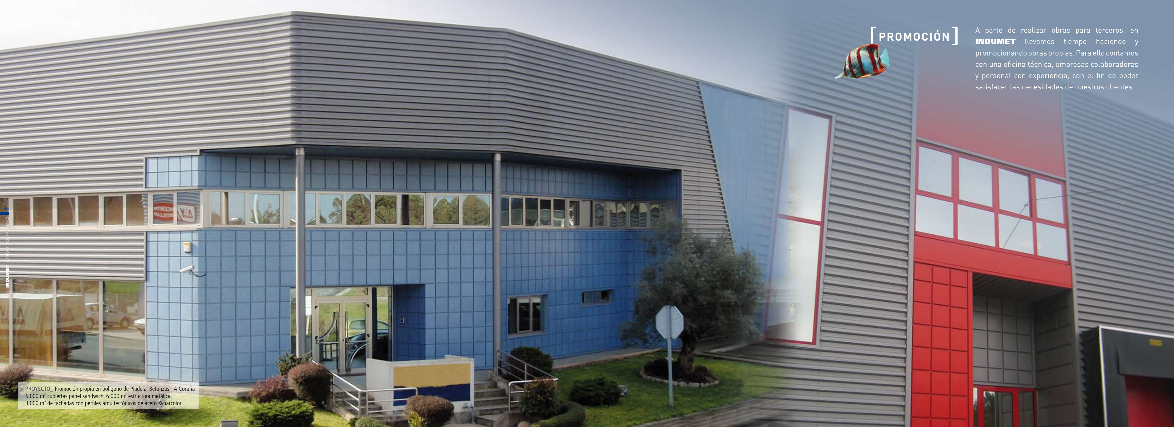
× PROYECTO_ Promoción propia en polígono de Piadela, Betanzos - A Coruña 6.000 m 2 cubiertas panel sandwich, 6.000 m 2 estructura metálica, 3.000 m 2 de fachadas con perfiles arquitectónicos de acero Kynarcolor

A parte de realizar obras para terceros, en INDUMET llevamos tiempo haciendo y promocionando obras propias. Para ello contamos con una oficina técnica, empresas colaboradoras y personal con experiencia, con el fin de poder satisfacer las necesidades de nuestros clientes.