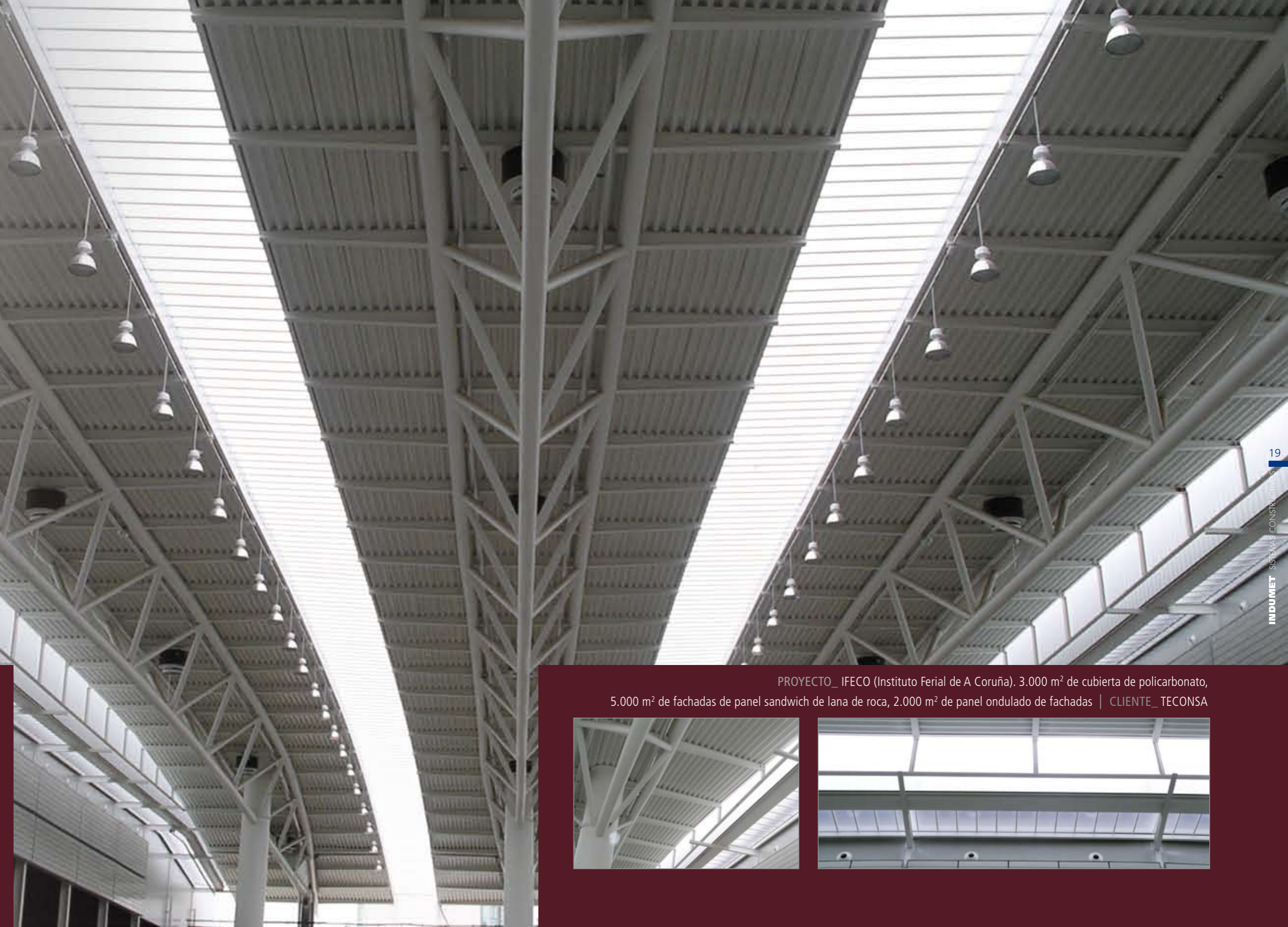
PROYECTO_ IFECO (Instituto Ferial de A Coruña). 3.000 m 2 de cubierta de policarbonato, 5.000 m 2 de fachadas de panel sandwich de lana de roca, 2.000 m 2 de panel ondulado de fachadas | CLIENTE_ TECONSA